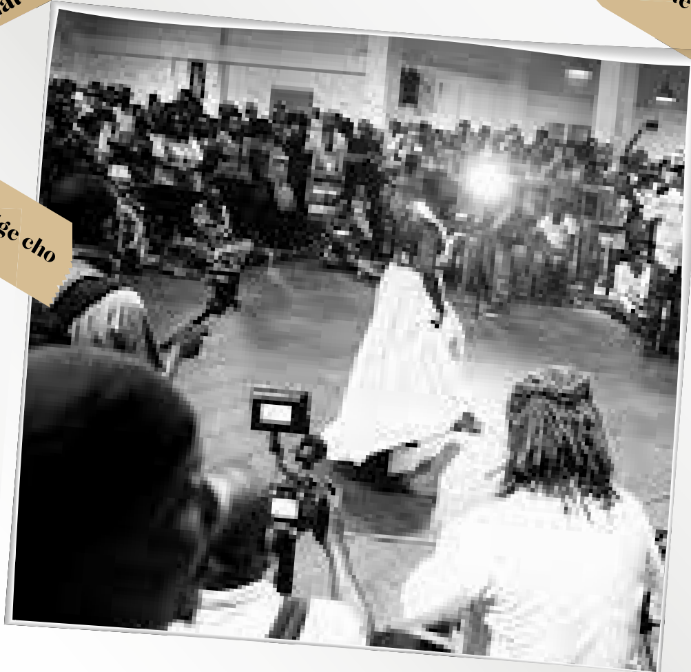
An lèwòz é kout-tanbou, pou soulayé nanm é pou ...