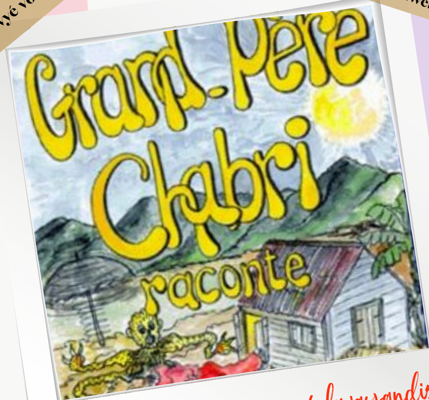
An larèl a kwayans é kwayandis, pou bay lavwa asi kakwè é pou ...