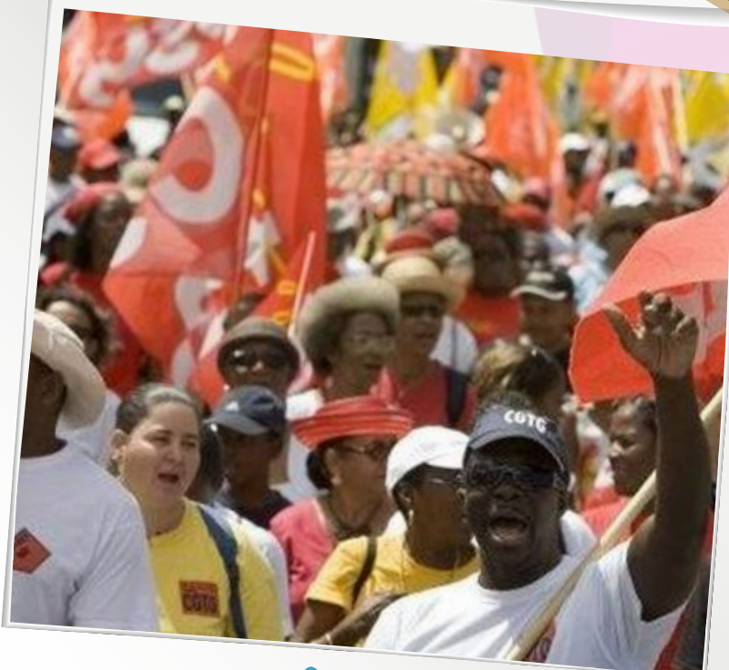
An grèv, pou tite é pou ...