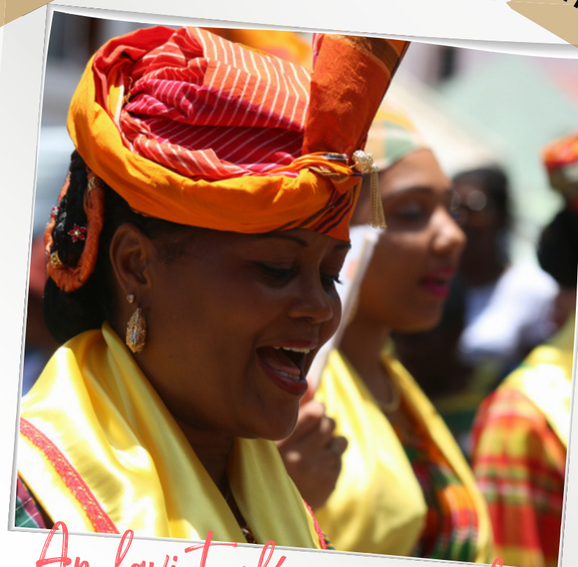
An lavi touléjou, pou gloriyé kilti é pou ...