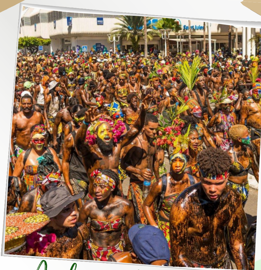
An kannaval, pou gyalaskò é pou ...